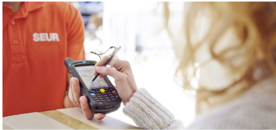
Entrega de un paquete de Seur.

Temas relacionados: Seur Ikea Fortune Iberia Start-up Pymes Tecnologías información Comercio electrónico Internet Tecnología Industria