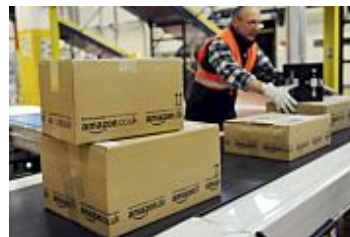
Amazon.es continua un día más con su 'Black Friday' con más...