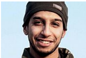
El cerebro de los atentados de París programaba un atentado en...