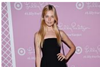
Una modelo se rebela contra los que la acusan de estar demasiado...