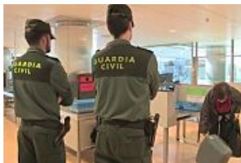
Estados Unidos emite una alerta mundial de viaje por el...