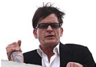
Las noches de Charlie Sheen: 100.000 dólares en prostitutas y 20... (LOC El Mundo)